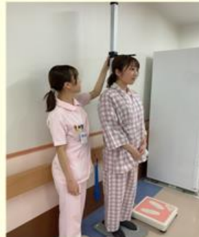
病衣に着替えて頂き、身体測定の実施