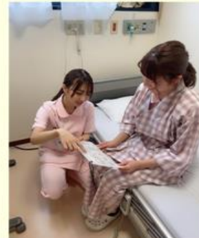
カテーテルオリエンテーションの実施