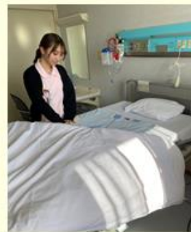
カテーテルの種類に応じて、BED準備