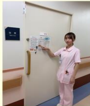
浴室の予約方法を説明