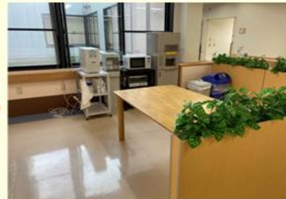
デイルームの使用方法について説明