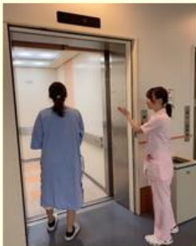
エレベーターで1階にあるカテーテル室までご案内