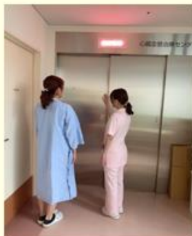
カテーテル室へ一緒に入り、ER看護師へ引き継ぎ