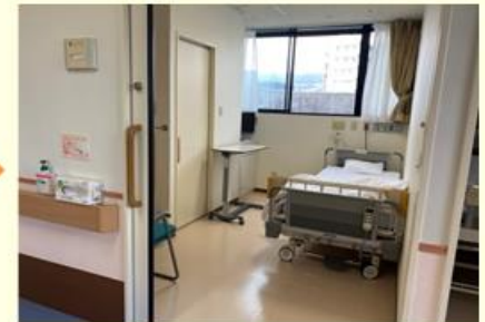
お部屋の場所や設備説明