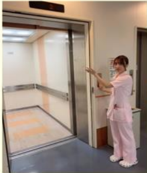
入院時間に受付へ患者様を迎えに行き、エレベーターで病棟へご案内